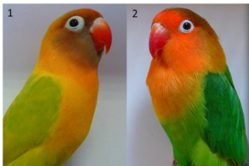
Bild 1. bastard mellan personata och fischeri, 2. Agarponis Fischeri