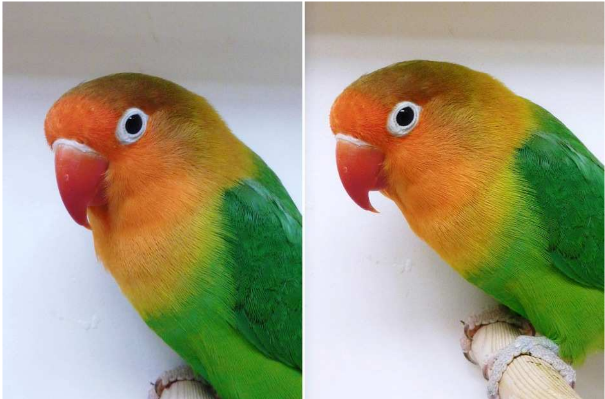
Fischeri: Normalfärgade ...mutationer kan vara vackra men ibland vinner originalet.