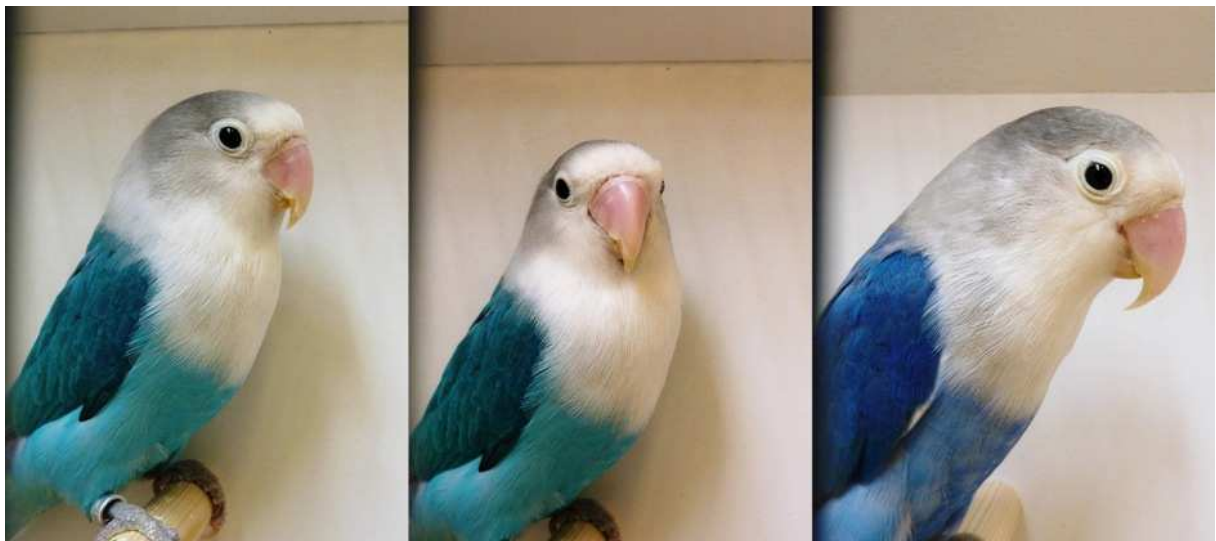
Fischeri: Två foton av Blå färgad och till höger en Cobolt färgad