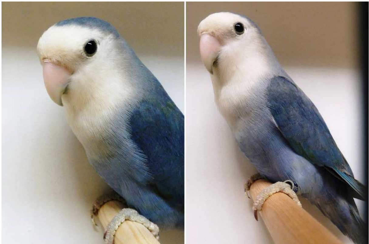
Roseicollis: vitmaskad cobolt viol, och till höger en cobolt färgad