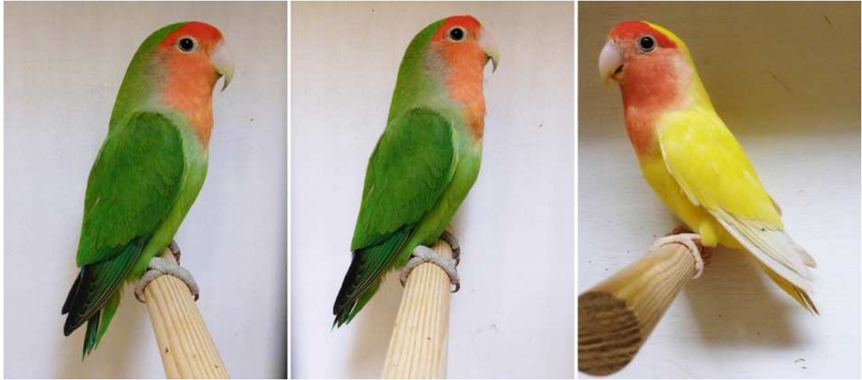
Roseicollis: Två normalfärgade och till höger en lutino