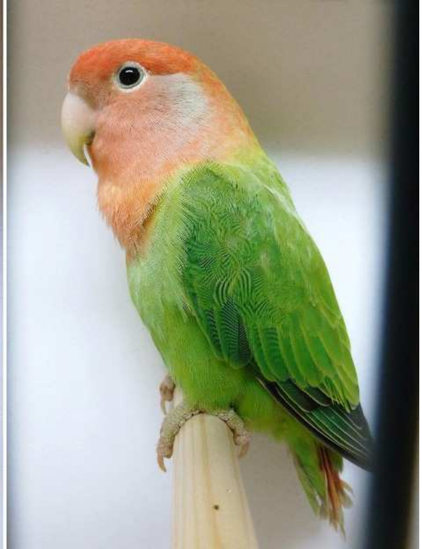
Roseicollis: Orangemaskad mauve och till höger en opalin