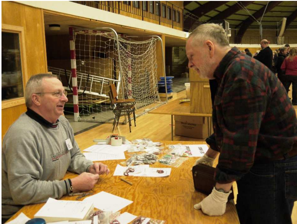
Kompisar träffas ...