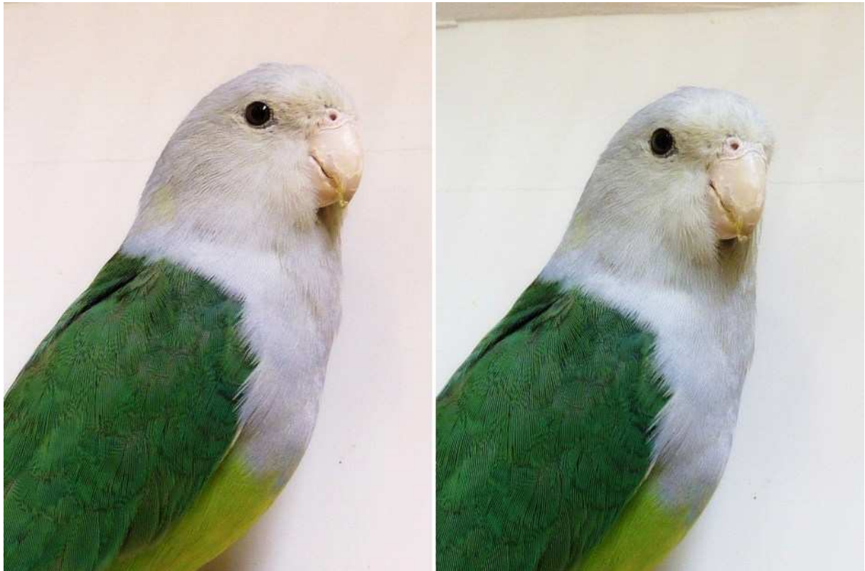
Oj, oj så stilig Agapornis Cana