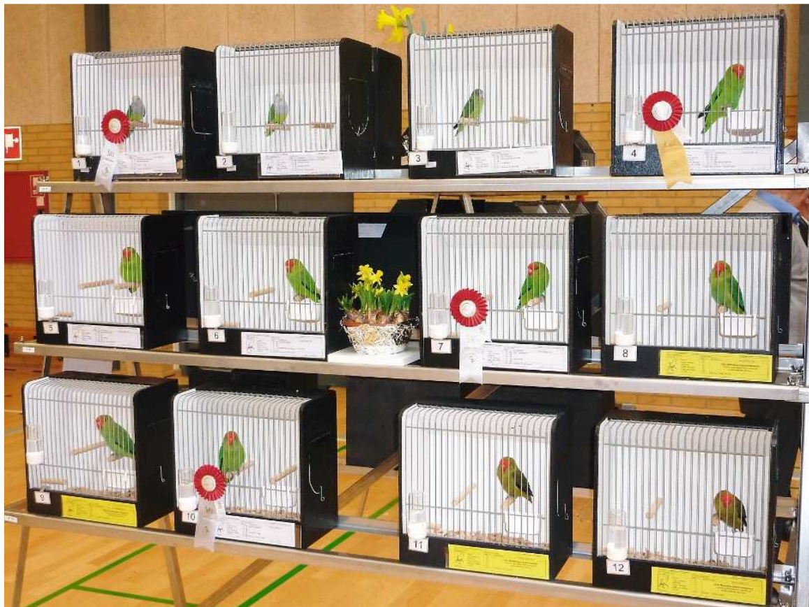
Här har fyra Tarantor fått första och andra pris