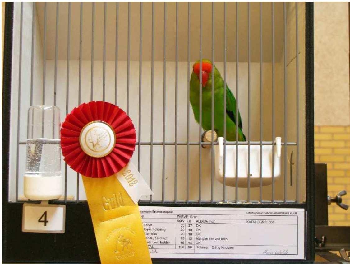
Är man en så här vacker och välväxt Taranta får man första pris...