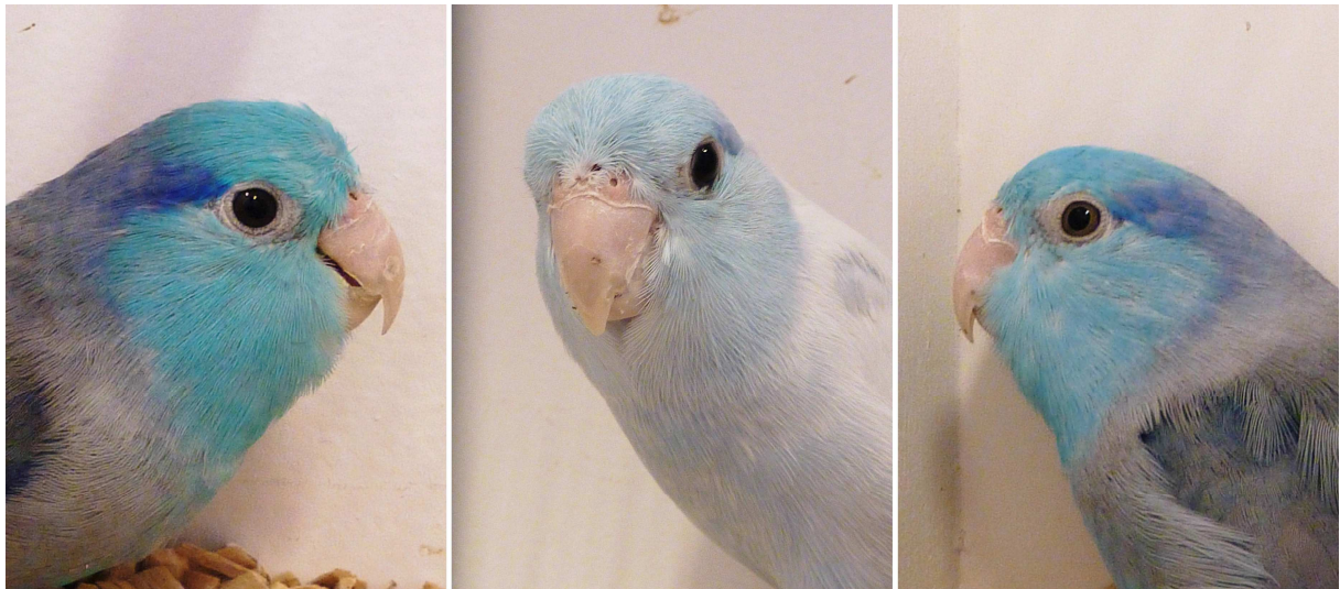
Lessons sparvpapegoja: Blå hane, ljusblå och blå hane