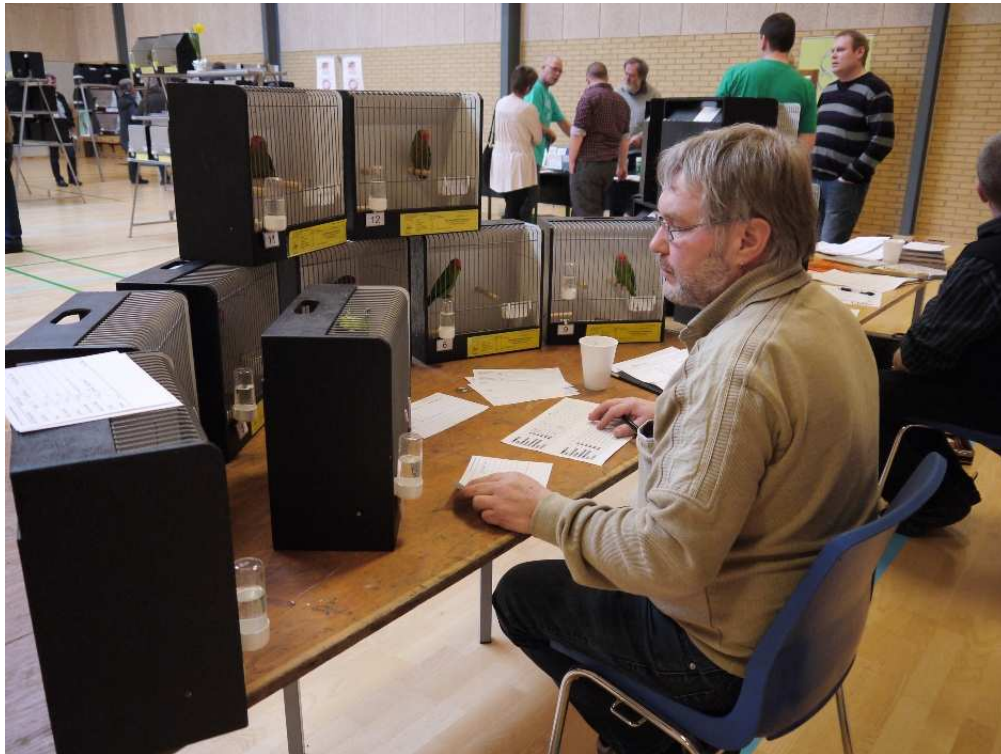
En av flera domare ...