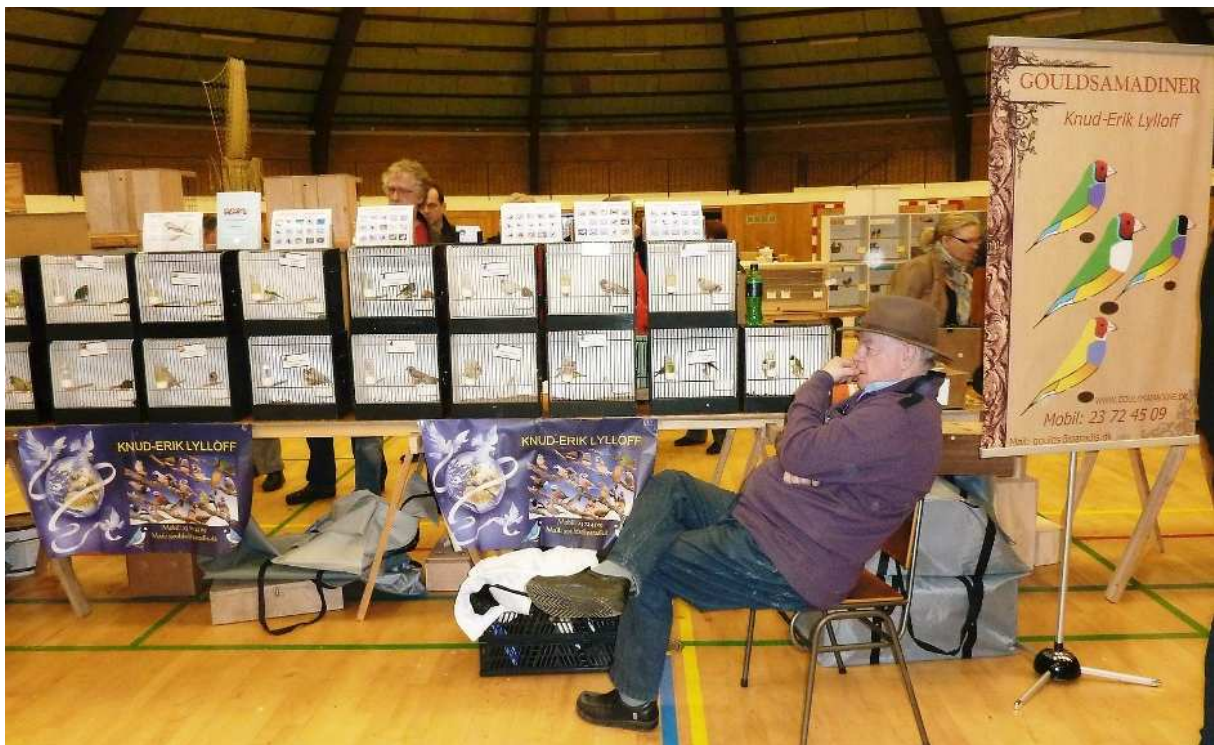
Titta på den här bilden, visst utstrålar den ett lugn och välbefinnande ... fåglar är bra för själen ...