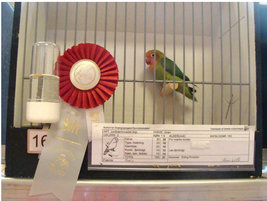
En Liliane får silver pris..